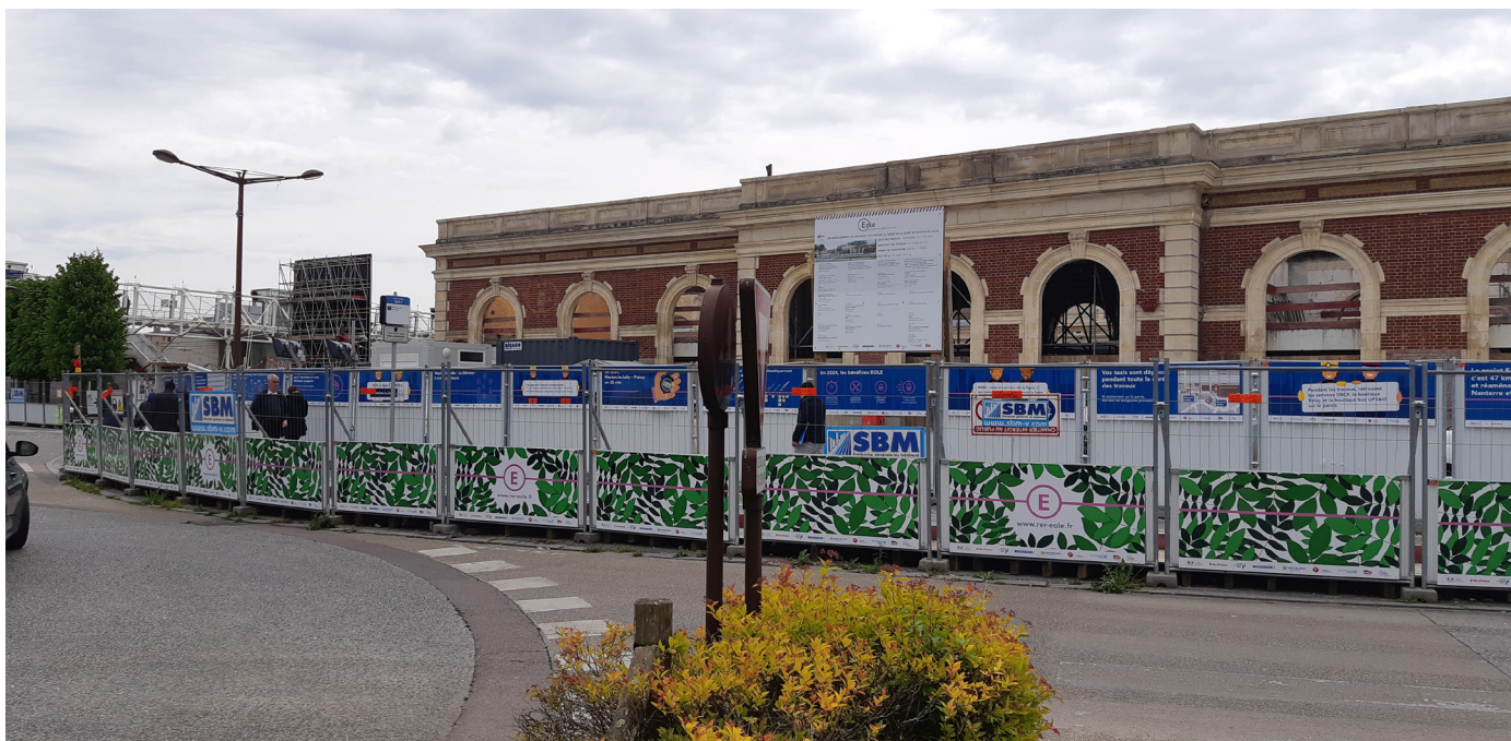
Parvis de la gare côté Mantes-la-Jolie

En janvier 2021 , après trois mois de travaux préparatoires, les travaux de gros oeuvre dans le bâtiment voyageurs commenceront.