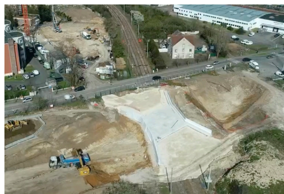
Nouvel ouvrage d'art rue de Buchelay - DRIC Projet Eole

➔ DU 20 AU 24 AVRIL 2021 , la rue de buchelay sera fermée à la circulation piétonne et routière pendant 4 nuits de 22h à 6h .